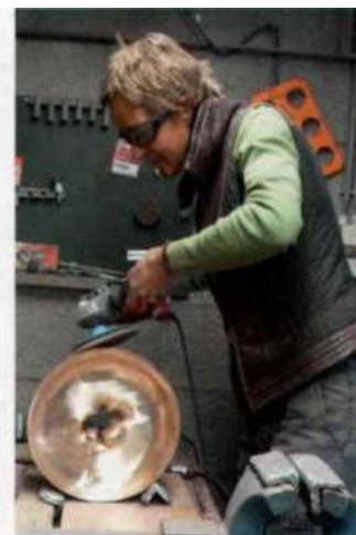
ci-dessus Feedback, 2012, bronze, 70 x 23 x 29 cm.

sculpture, c'est la révélation ! Tournant autour de l'œuvre, son corps tout entier se voit enfin impliqué dans une communion avec la Terre. Une relation qui peut se charger d'une certaine violence quand elle s'attaque directement à la matière, quand elle en mesure la force et les résistances. A l'inverse, la rencontre peut se faire tendresse lorsque sa main se change en caresse. Souvent, ses gestes ne font qu'interpréter ce que la terre lui dicte. L'artiste laisse alors les choses se faire, la magie opère. Infatigable chercheuse, elle expérimente sans cesse, invente ses propres techniques, développe des manières de faire (en utilisant, par exemple, des matériaux inhabituels : mousse de polyuréthane, bois, terre, tissus, bas...), bricole même ses outils. Un apprentissage constant et empirique : chaque sculpture lui apprend quelque chose, la place devant de nouvelles difficultés et enjeux techniques. L'artiste progresse grâce aux